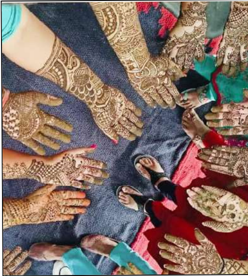
मेहंदी प्रतियोगिता में सजे हाथों को दिखाती छात्राएं।

विभिन्न प्रतियोगिताएं आयोजित, 50 से अधिक छात्राओं ने लिया हिस्सा