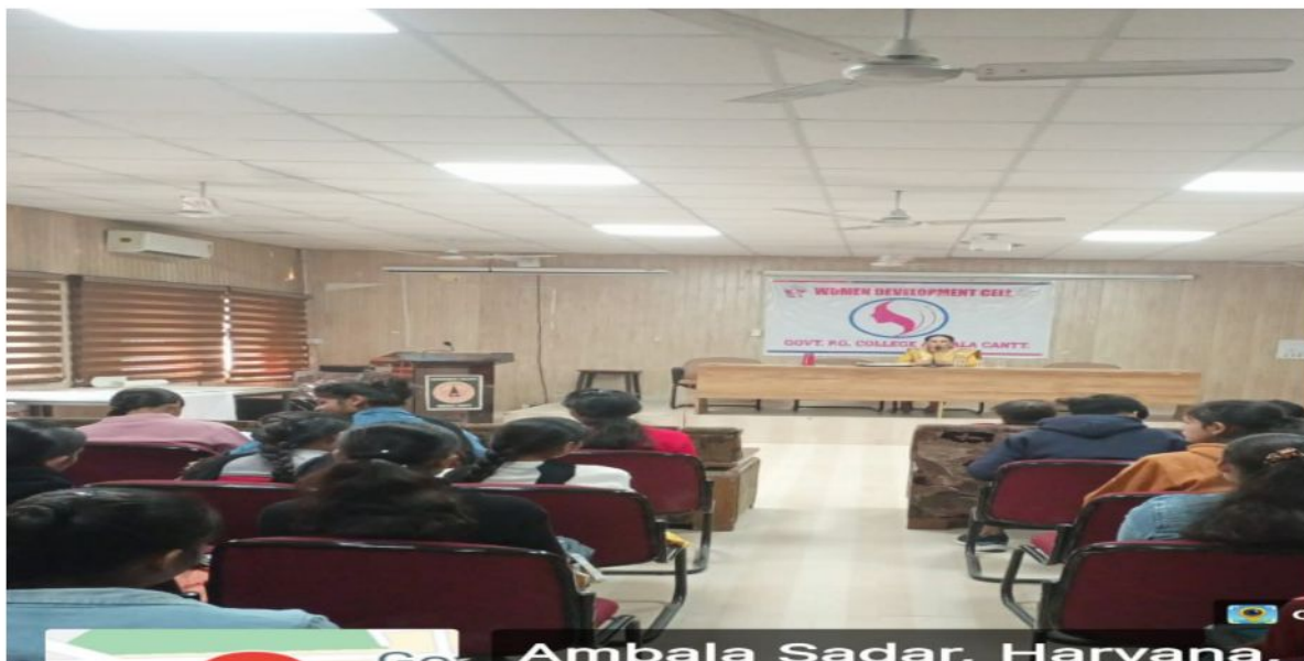
Ambala Sadar, Haryana,