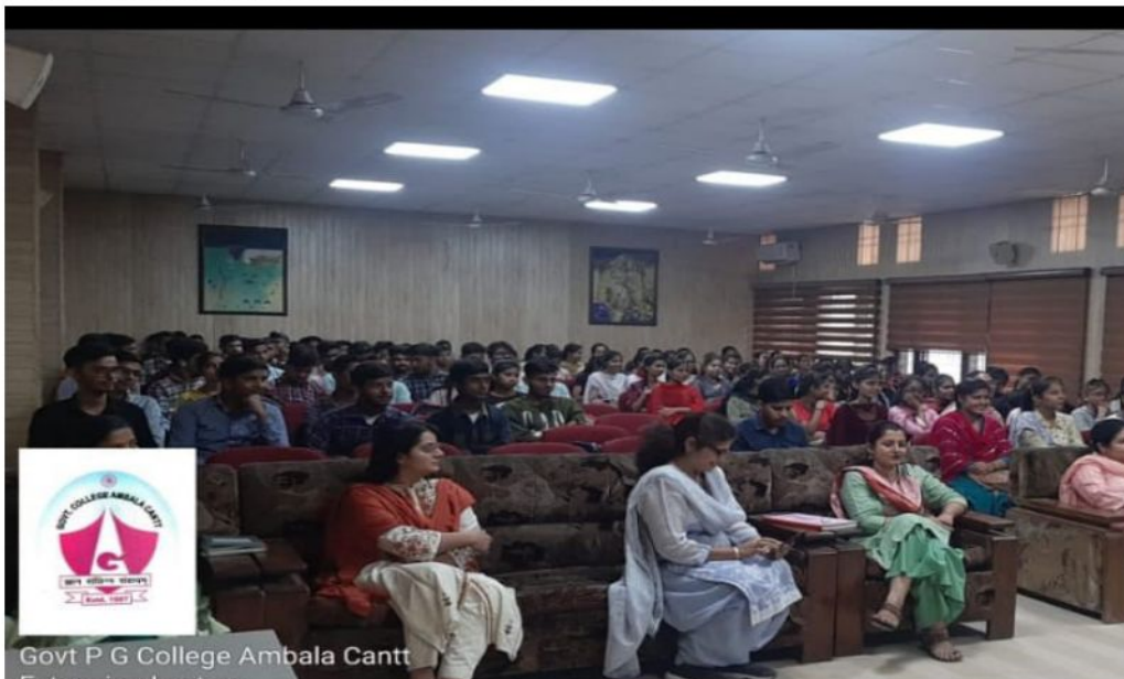
Govt P G College Ambala Cantt Extension Lecture