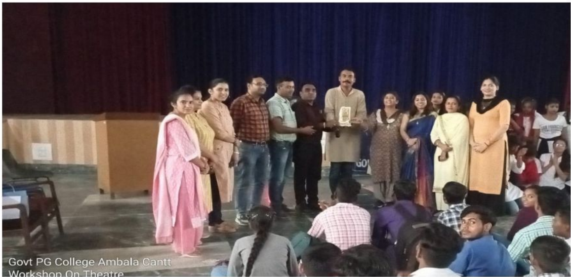
Govt PG College Ambala Cantt Workshop On Theatre