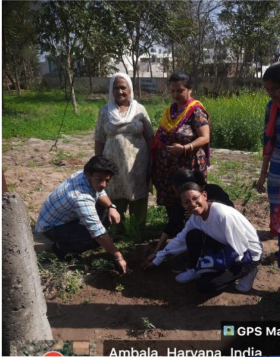
Ambala, Haryana, India