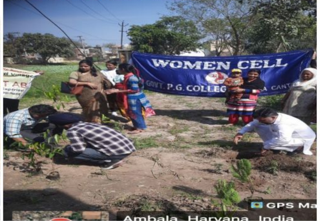
Ambala, Haryana, India