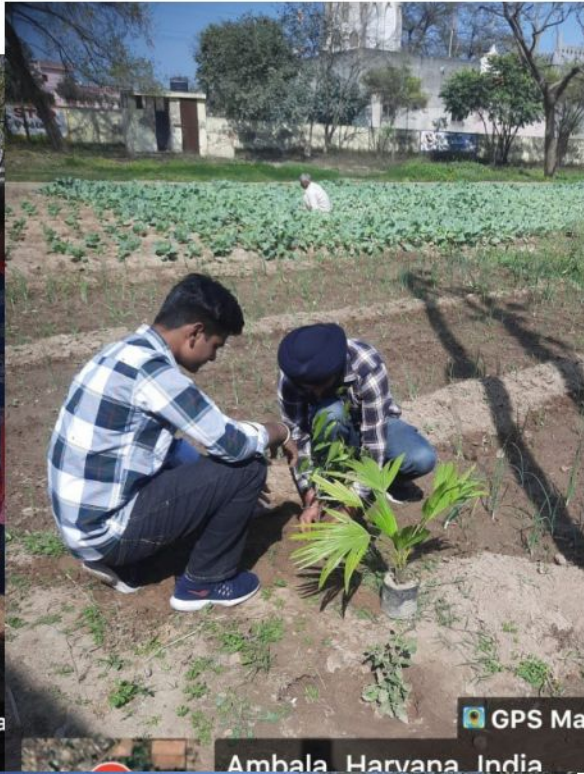
Ambala, Haryana, India