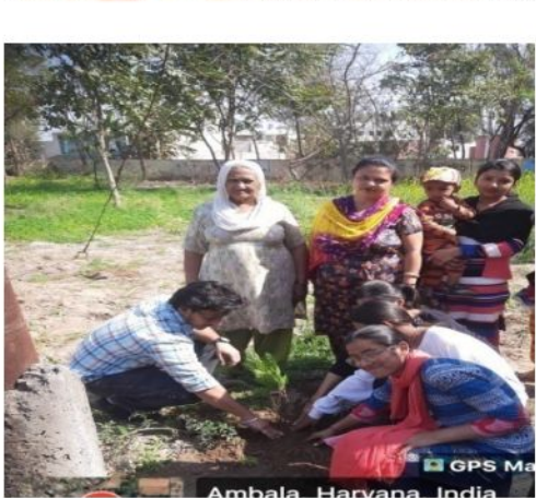
Ambala, Haryana, India